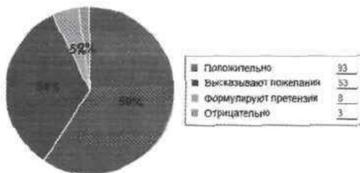
Как родители оценивают детский сад

Анкетирование родителей показало высокую степень удовлетворенности качеством предоставляемых услуг.